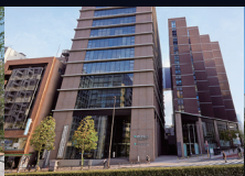
国際医療福祉大学