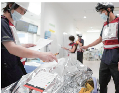
トリアージの訓練