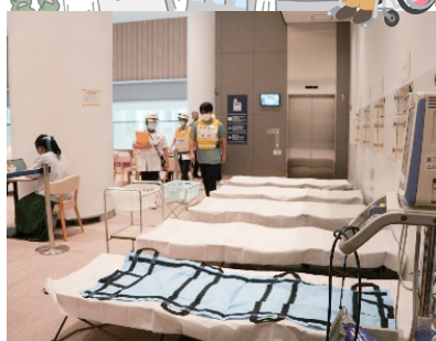
C 棟 2 階カフェエリア付近での訓練