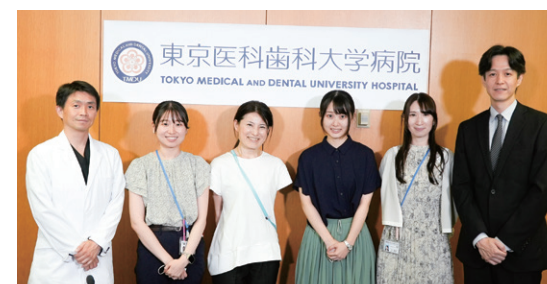
テーマは「脳神経外科・血管内治療科の最前線」

2024年7月2日、「脳神経外科・血管内治療科WEB講演会」を開催しました。たくさんの方にご参加いただき、ありがとうございました。ここでは講演の内容についてご紹介します。今回のテーマは、「脳神経外科・血管内治療科の最前線」で、脳神経外科と血管内治療科が有する最新の設備と治療技術による、頭部外傷、脳卒中、てんかん、脳腫瘍、脳機能性疾患などの中枢神経疾患に対する高度な医療についてご説明いたしました。特に脳卒中に関しては両科が緊密に連携し、24時間体制で患者を受け入れる体制を整えています。また、超急性期の脳卒中患者に対しても迅速な診断と治療を行い、血管内治療や外科的手術を適切に選択して治療にあたります。平日日中で診断が明らかな場合は脳神経外科・血管内治療科の外來で、また診断に迷われる場合や時間外でも救命センターを通じて24時間患者さんを受け入れています。地域の医療機関の皆様には、患者さんの迅速な紹介と連携をお願い申し上げます。