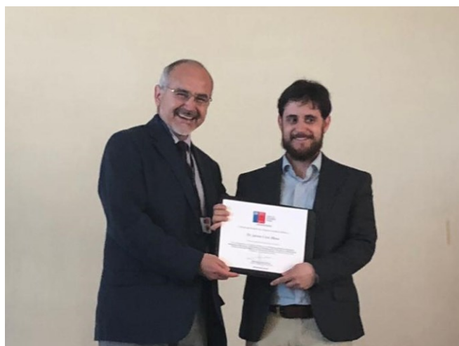
左よりカセレス医師、クルス医師