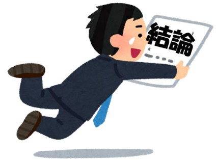
図1. 結論への飛躍のイメージ

妄想を持つ患者さんでは、健康な方に比べてより少ない情報にもとづいて結論を下す、「結論への飛躍 (jumping to conclusions)」(図1) と呼ばれる認知的な傾向があることが知られており、このために誤った考えに至りやすい、つまり妄想の形成しやすさを説明するメカニズムと考えられています。また健康な方の場合は逆に、結論を下すためには客観的な確率が示すよりも多くの情報を要するという「保守性バイアス (conservatism bias)」と呼ばれる傾向が知られていません。結論への飛躍と保守性バイアスに関わる脳神経領域を探る研究がこれまで行われてきましたが、はっきりした結論には至っていませんでした。