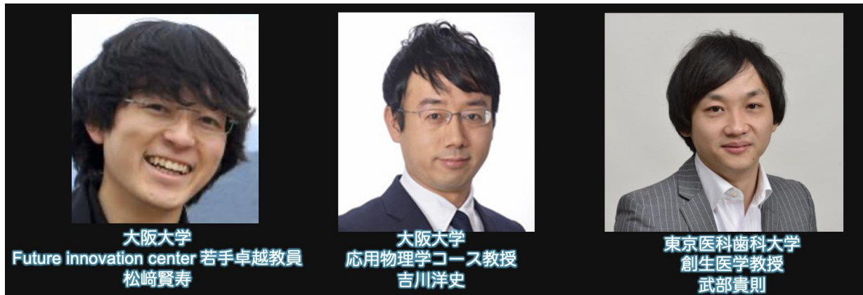
図 3: 3人の責任著者