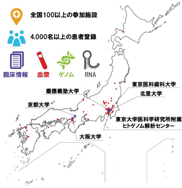
【図2】 全国に広がるコロナ制圧タスクフォースのネットワーク