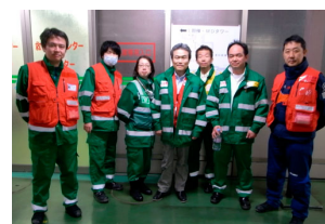
救援活動を終え帰京した派遣メンバー。