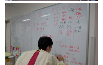
都内でも死傷者が出たため、対応に追われるERセンターのスタッフ。