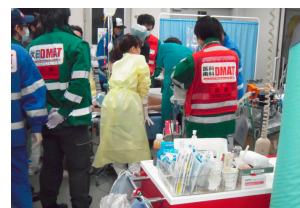
重症エリアの診療風景。

第2隊(3/16～19、岩手県庁、大船渡病院)、3隊(3/20～22、福島県庁)の活動に関しては、HP http://www.tmd.ac.jp/accm/topic/60_4e085d506b0f7/ をご覧ください。