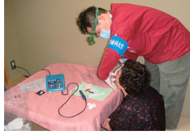
避難所を巡り被災者の応急処置を行う歯科医師。

東京医科歯科大学では厚生労働省、日本歯科医師会、学術団体などと連携して、被災地への歯科医師、歯科衛生士の派遣や、必要な物品、器材の提供による歯科医療支援活動を行っています。