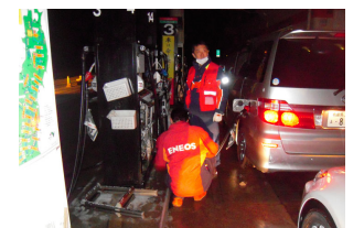
停電のサービスエリア。手で給油した。

ビジネスホテル ルートイン仙台長町着。宿泊交渉OK。チェックイン時にホテルの人にパンをいただく(小さいパンを1人3個)。ライフラインがないためホテル内は真っ暗。仮眠。