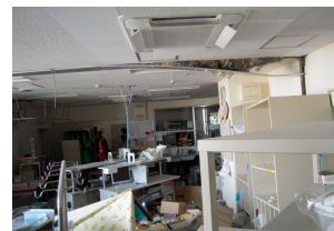
東北厚生年金病院看護ステーションの被害状況。