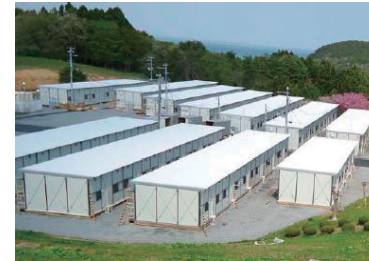
戸倉自然の家の仮設住宅。

ていたのは国境なき医師団など国際的に医療支援を展開している団体だったと思われる。紛争地の難民を援助する団体のノウハウは実は自国の同胞を助けるのにも必須のものであった。