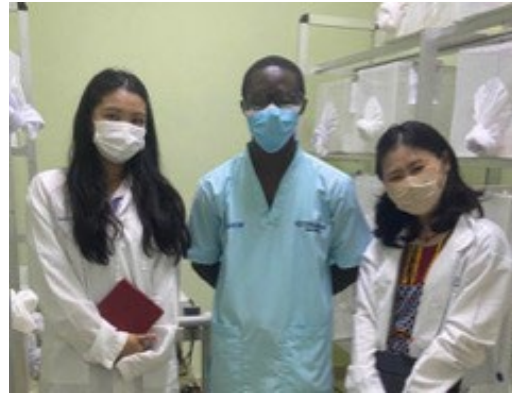
写真 4) 野口研での研究 風景