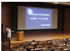
嶋田病院長による5S活動キックオフ宣言