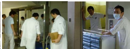
整理・整頓のスタート