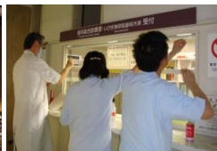
5S推進委員会委員がまず実践