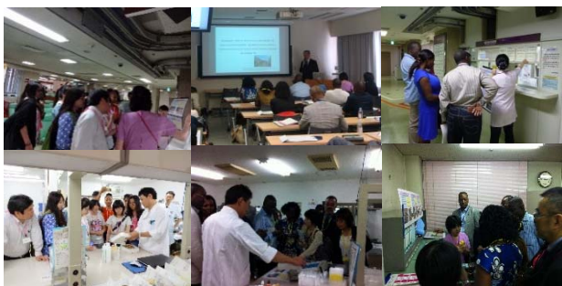
JICA・台北医学大学の研修協力