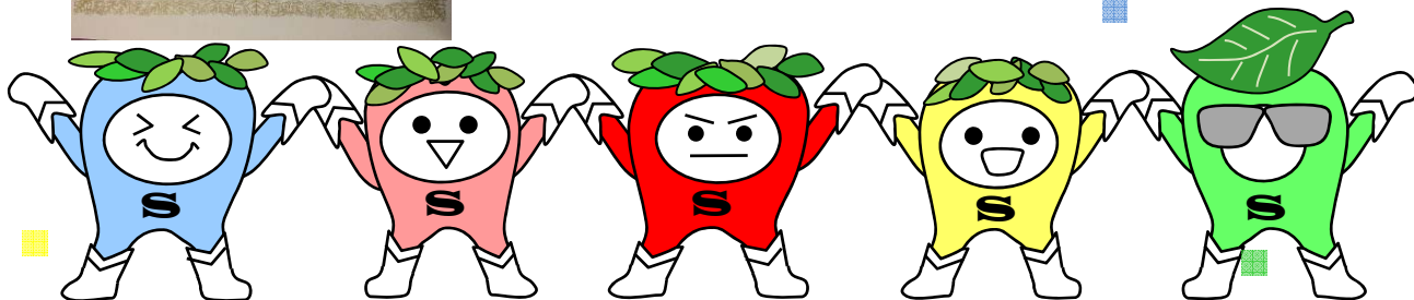
東京医科歯科大学歯学部附属病院 5S活動キャラクター「5Sレンジャー」

歯学部附属病院5S活動の取り組み紹介 http://www.tmd.ac.jp/denthospital/5Shomepage.html