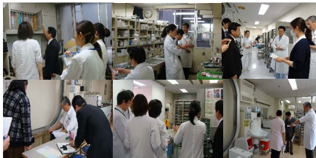
外部評価者による5S監査ラウンド