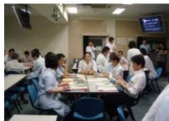
リーダー研修会でリーダー全員が5S活動を体験