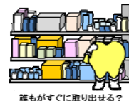
誰もがすぐに取り出せる？