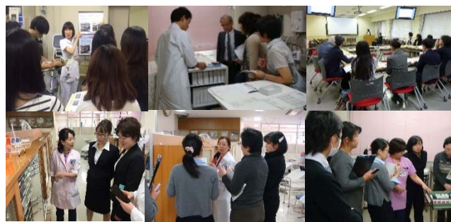
国内の医療機関からの視察

✿ 6年間の地道な活動が認められ医療チーム功労賞の受賞となりました。今後も歯学部病院がますます良い病院になりように力を合わせて頑張っていきます！！