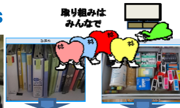
取り組みはみんなで