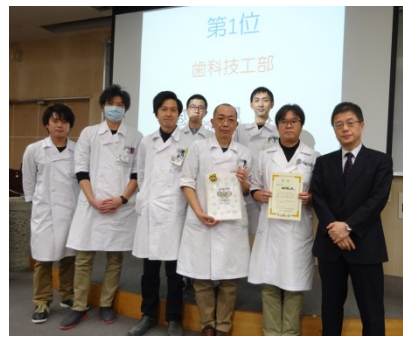
「5Sのエース！」歯科技工部が見事1位に返り咲きました。