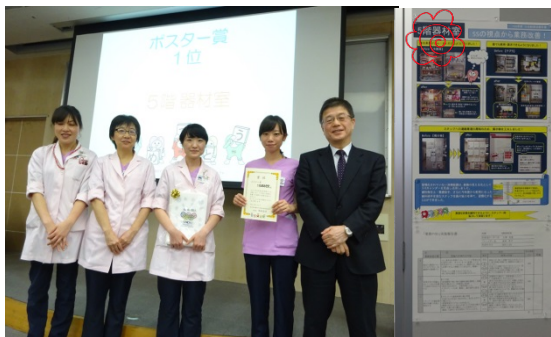
職員の投票の結果、ポスター賞は5階器材室がダントツの1位でした。