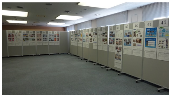
5Sラウンドに先立ち、3階大会議室において5S成果ポスターの展示が行われました。創意工夫に溢れる他科の取組みはとても参考になります。