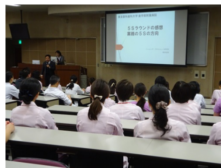
5S監査院内ラウンド講評・表彰式に集まってくださった職員の皆様。