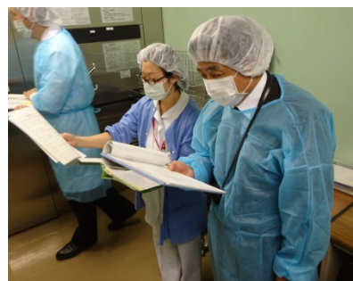
2日間で院内42部署をラウンドされる高原講師も本当は大変です。いつも厳しい視点から貴重なアドバイスを下さいます。