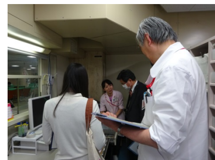
俣木委員長も自身の歯科総合診療部のラウンドの際は内心ドキドキでしょうか??