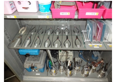
赤マル急上昇が納得の整理整頓が行き届いた棚（小児歯科外来）。