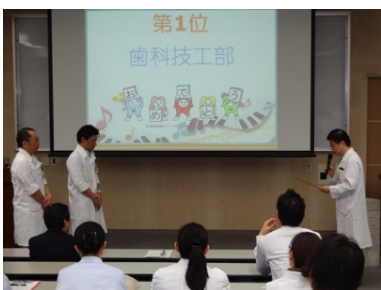
ディフェンディングチャンピオンの技工部が、僅差で4階器材室に競り勝ちました。