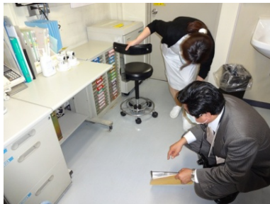
机の下までチェックされました（歯科麻酔科外来）。