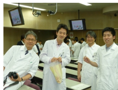
大躍進の義歯外来。賞品を手にスマイル。