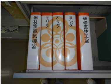
5Sを楽しむ余裕が見えます（4階器材室）。