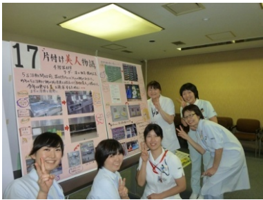
“片付け美人物語” そうだ、器材室に行こう！（ポスター発表会）

去る2月12日～15日に5S活動のポスター発表会が、2月14、15日には今年度2回目の高原先生のラウンドがありました。今回は全ての部署が得点アップし、賞の選定には苦労されたようです。