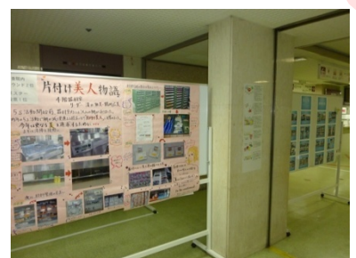
今年も優れたポスターをロビーに展示しました。