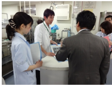
昨年成果をあげた部署ほど、二年目は大変だったことでしょう（歯周病外来）。