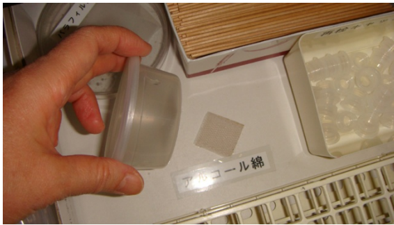
容器を元に戻しやすいように、マジックテープで工夫がされています(検査部)。