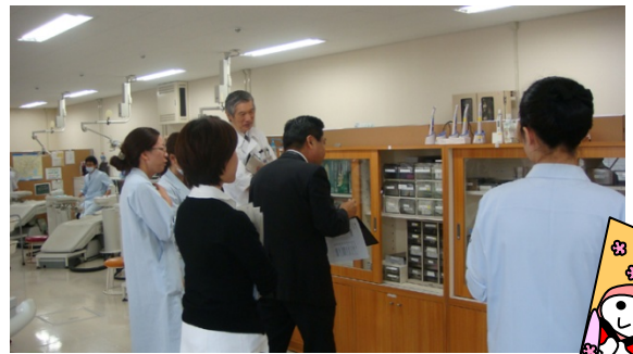
頑張ると、あそこもここも見て欲しい(小児歯科)。