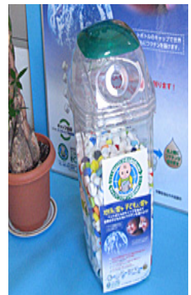
ペットボトルキャップ 専用回収ボックス