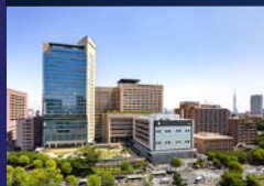
東京医科歯科大学