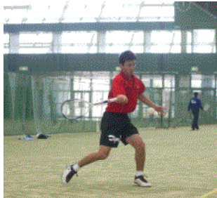
何事も基本が大事

みなさんと一緒に実戦とその理論を学び、そして分かち合いをとおして次世代の育成を考えます。