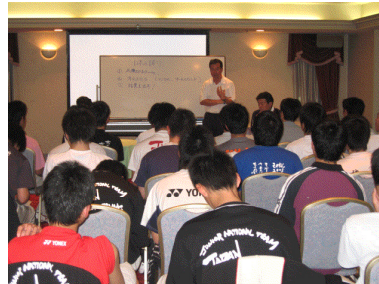
理論を生かす実戦講座