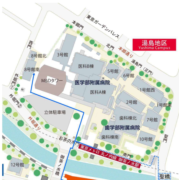
図1 東京医科歯科大学 8号館南へのアクセスマップ

クライオ電子顕微鏡を用いた単粒子解析法の構造解析例の話題提供。AAA (ATPase associated with various activities) ファミリータンパク質は、原核から真核生物に至るまで存在し、保存されたモジュールから構成されると共に生体内での多種多様なプロセスに関わっている。そのうちのひとつである Mdn1 は真核生物において 60S サブユニットの成熟ステップに関わるリボソーム非構成因子であり、そのドメイン配列の類似性からモータータンパク質ダイニンと同様の power-stroke motion を伴う機能を持つと推察されていた。全長 Mdn1 の構造からは、C 末側リンカードメインは大きく曲がることなく N 末側の AAA ドメインから遠く伸びていることが示された。また、特異的阻害剤 Rbin-1 存在下での構造から、最 C 末端の基質結合ドメインが ATP 加水分解依存的に AAA ドメイン上へドッキングすることも明らかになった。これらのことから、Mdn1 においては AAA ドメイン自身の構造変化により、pre-60S 粒子への結合と共に pre-60S 粒子上にある標的基質の脱離を直接調節していることが示唆された。