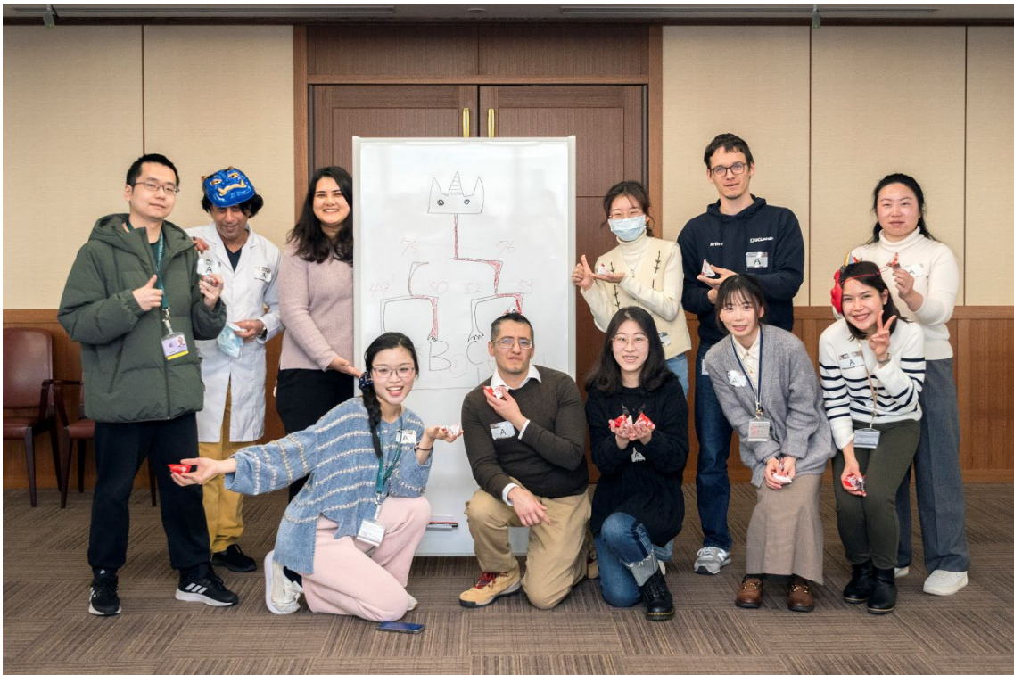
3位 A チーム