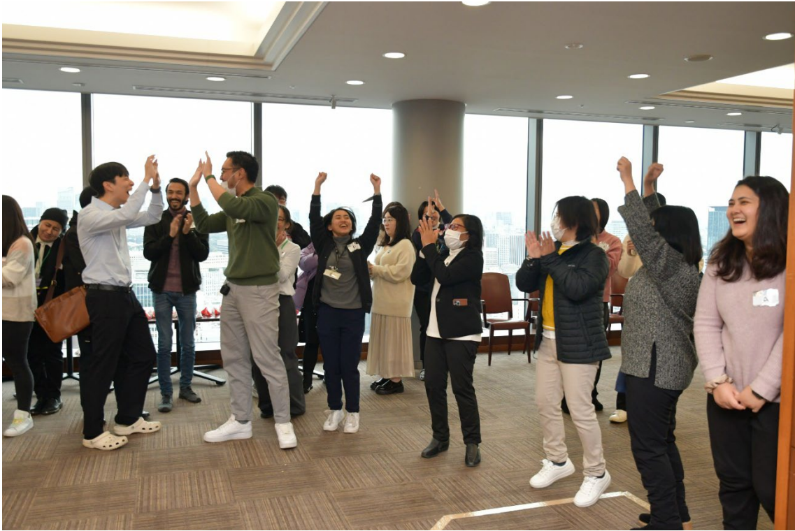
アクティビティーを楽しんでいる様子