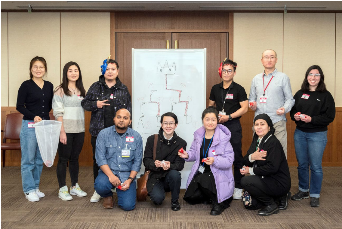
準優勝 B チーム