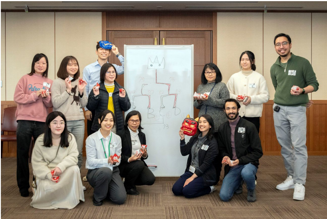
優勝 D チーム