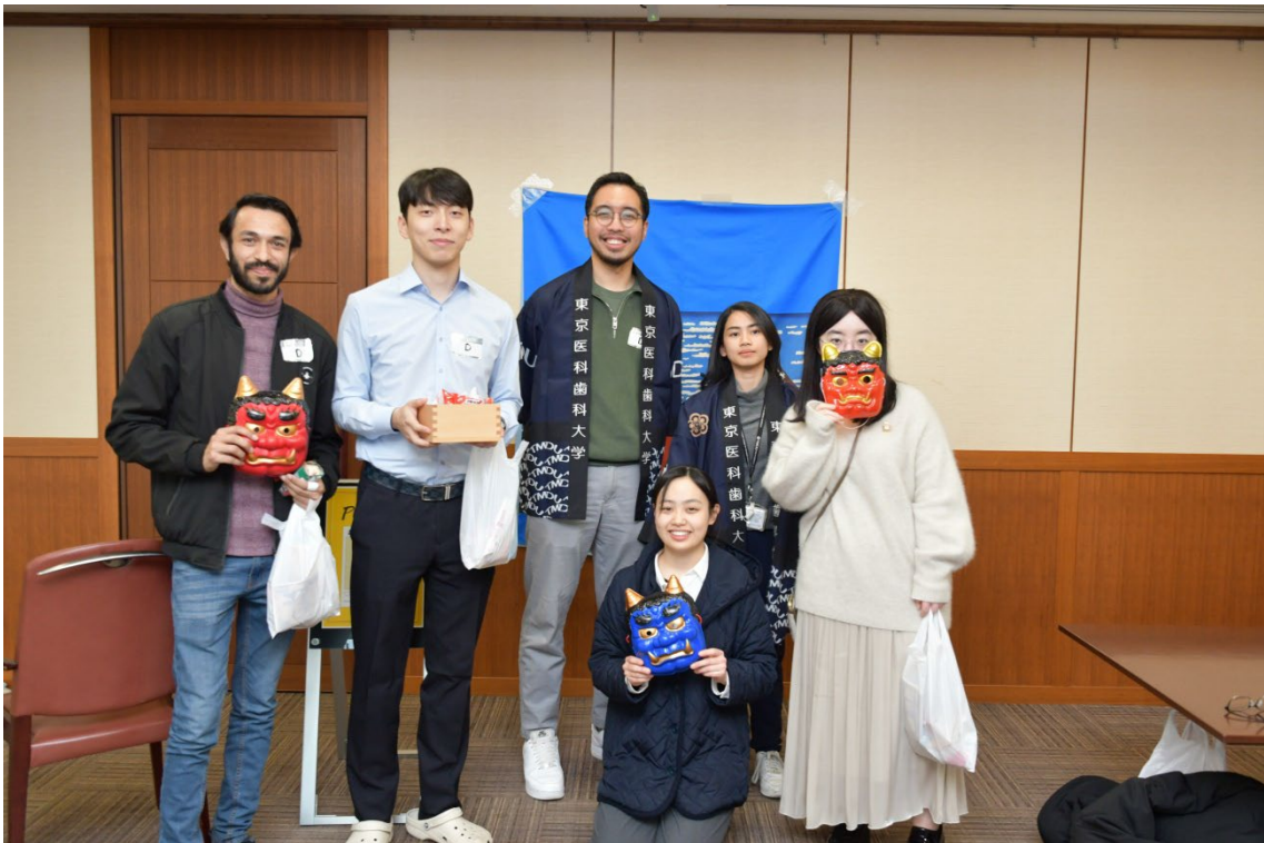
フオトスペースでの写真