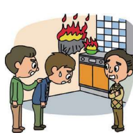
下宿先でボヤを出し 大家さんに弁償した