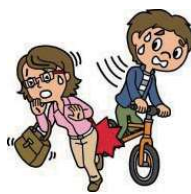
自転車で相手にケガをさせた