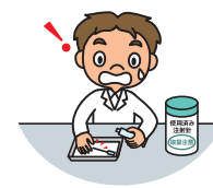
臨床実習中の針刺し事故 （検査費等を実費払い）