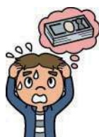
扶養者が事故で死亡し 授業料が払えなくなった