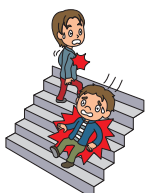
キャンパス内でのケガ