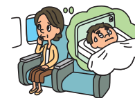
学生が入院し家族が駆け付けた