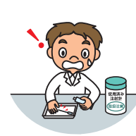
臨床実習中の針刺し事故（定額払い）