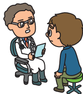
風邪をひいて通院した（1日目から対象）

加入される場合は、専用Webサイト（本ご案内の表面にも記載）からお申し込み下さい。