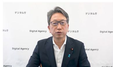
平 国家公務員制度担当大臣(当時) 開講挨拶