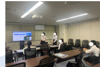
政策の企画・立案プロセス 体験