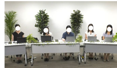
パネルディスカッション (内閣人事局)