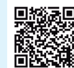
感染症内科ホームページ