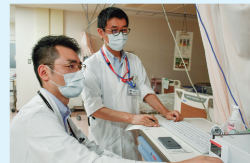
ICUの患者さんを回診する様子