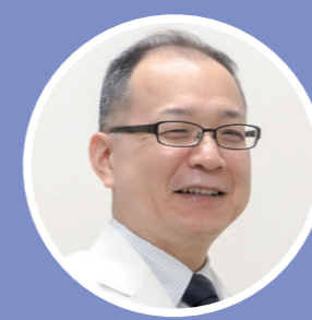
東京医科歯科大学病院 医療連携支援センター長 (病院長補佐)