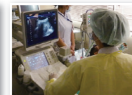
肝がんラジオ波治療の様子