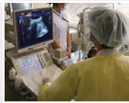
肝がんラジオ波治療の様子

未だ抗ウイルス治療を受けたことがない方、これまでの治療では治らなかった方、治療の難しい肝硬変・肝がんの方、あるいは糖尿病や脂肪肝などの生活習慣病に伴う肝疾患の方など、多数の患者さんのご紹介をお待ち申し上げております。