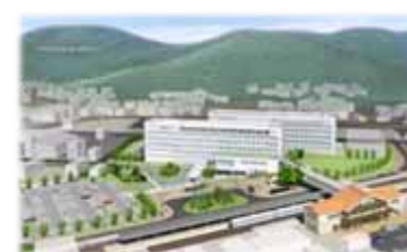
浜田医療センター(完成予想図)