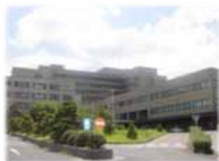
島根大学附属病院