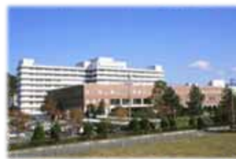
秋田大学附属病院