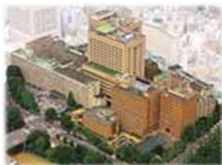
東京医科歯科大学