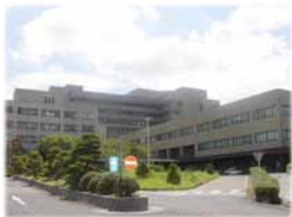
島根大学附属病院