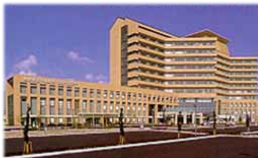
島根県立中央病院