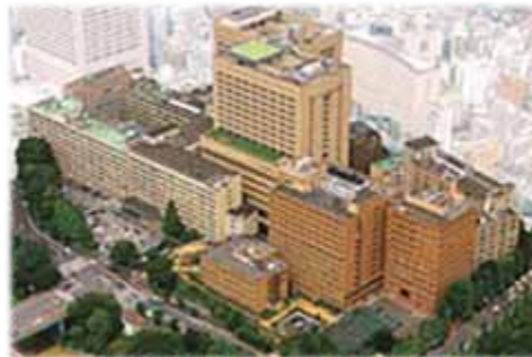
東京医科歯科大学