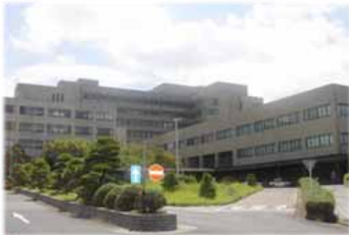
島根大学附属病院