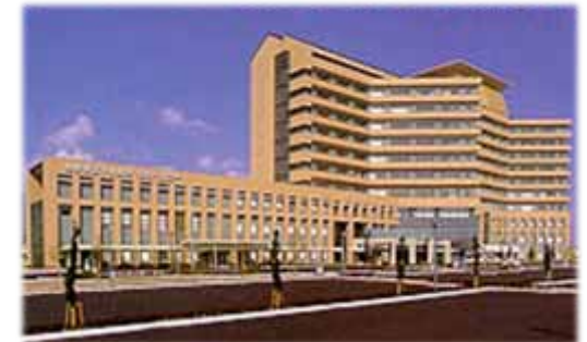
島根県立中央病院