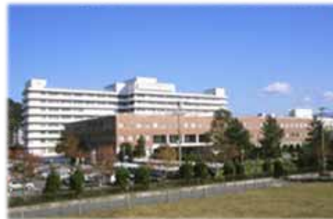
秋田大学附属病院