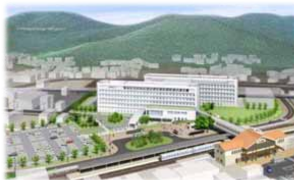
浜田医療センター(完成予想図)