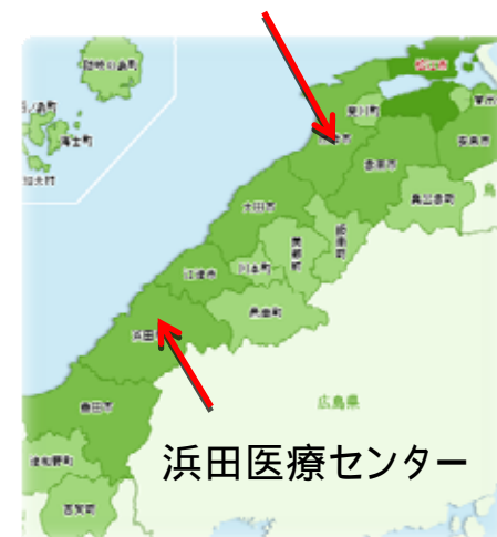
浜田医療センター