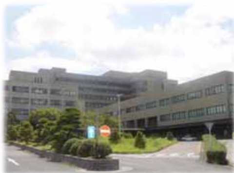
島根大学附属病院