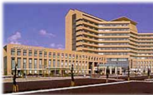
島根県立中央病院