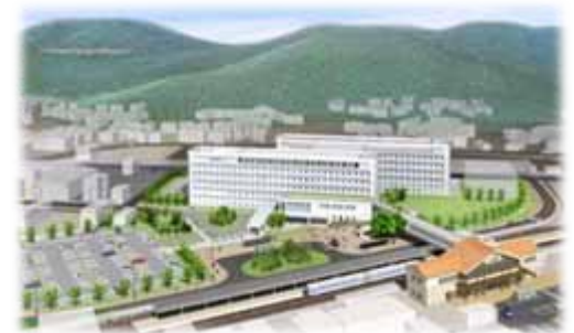
浜田医療センター(完成予想図)