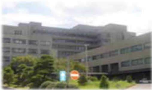
島根大学附属病院