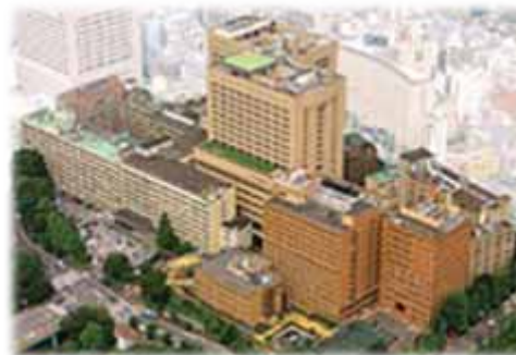
東京医科歯科大学