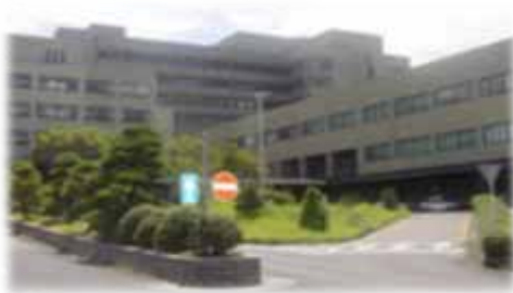
島根大学附属病院