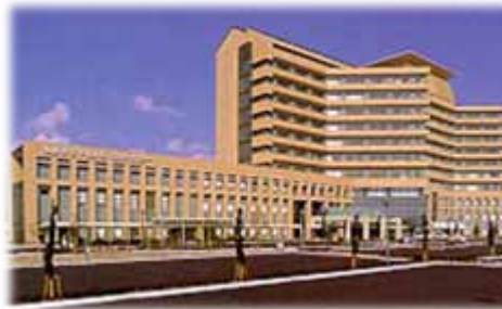
島根県立中央病院