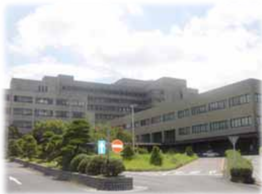
島根大学附属病院