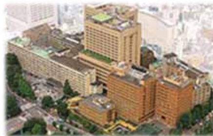
東京医科歯科大学