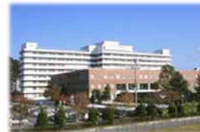
秋田大学附属病院