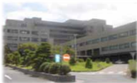
島根大学附属病院