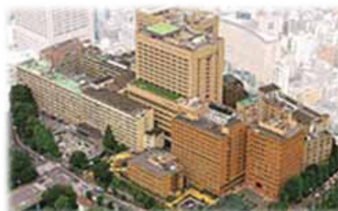
東京医科歯科大学