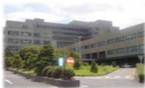
島根大学附属病院