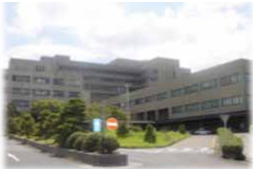
島根大学附属病院