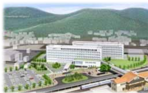
浜田医療センター(完成予想図)