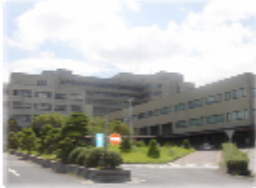
島根大学附属病院