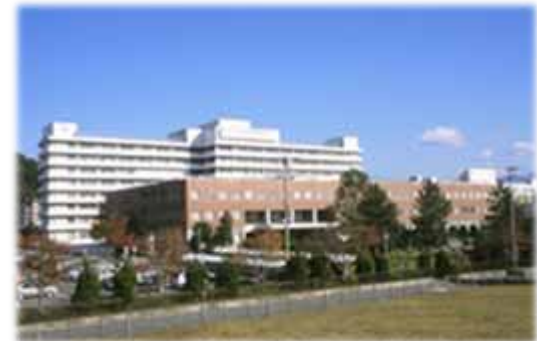
秋田大学附属病院