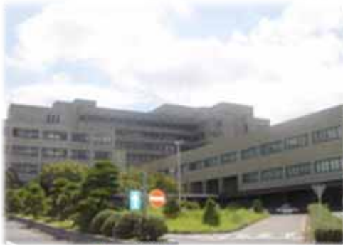
島根大学附属病院