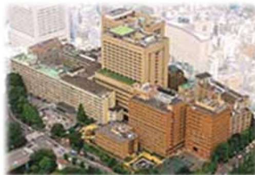
東京医科歯科大学