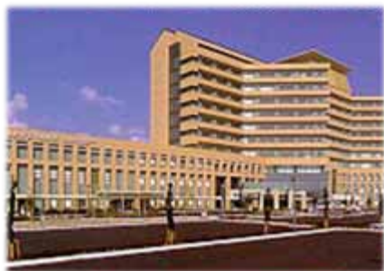
島根県立中央病院