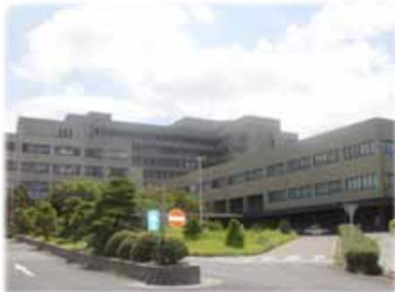
島根大学附属病院