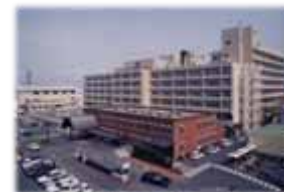
島根大学附属病院