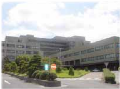
島根大学附属病院