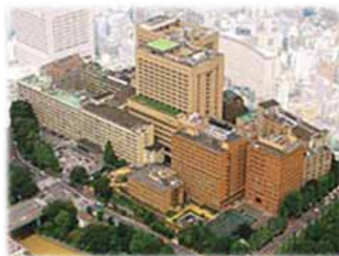
東京医科歯科大学