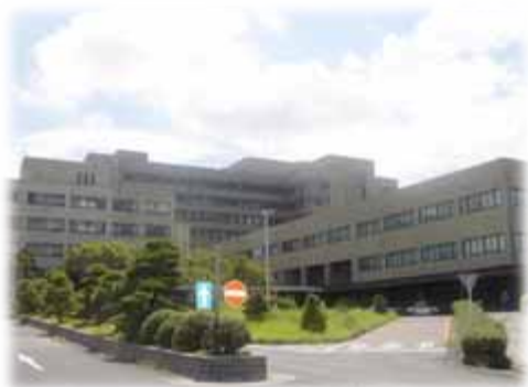
島根大学附属病院