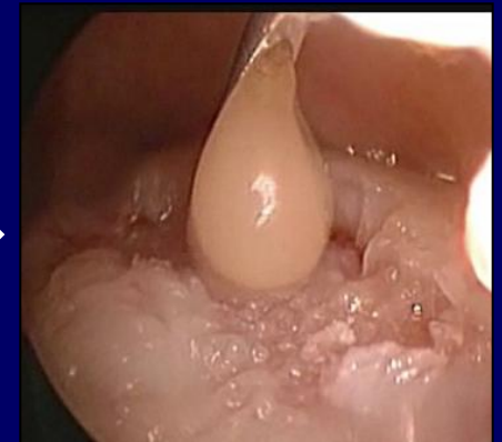
細胞浮遊液の静置