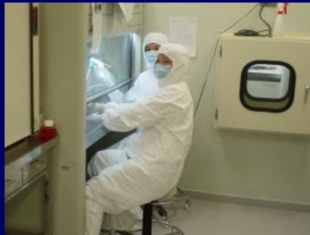
本学細胞治療センター