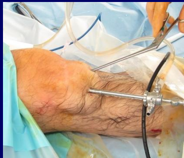
外来手術で 滑膜採取